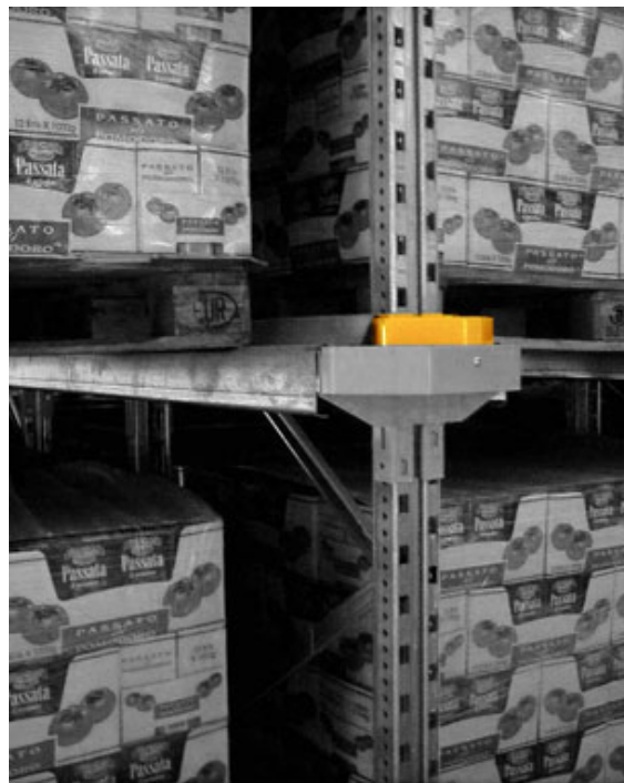
Einführung für Auflagen, Konsolenschutz